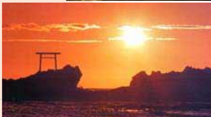
写真はどれもイメージ写真です。